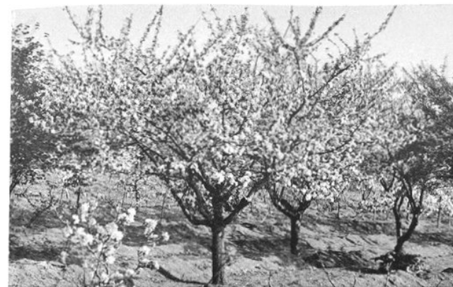
Quand faut-il surgreffer ?

Les pommiers sont en fleurs, c'est l'époque à laquelle vous devez effectuer les surgreffages.