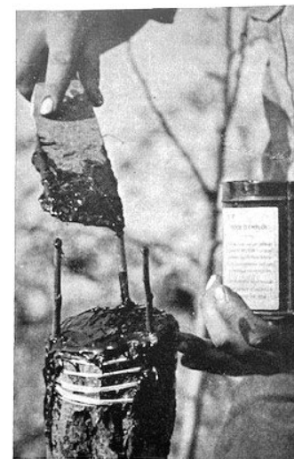
Englueusement de la greffe.

Pour terminer l'opération, engluez toutes les plaies apparentes. N'oubliez pas l'extrémité des greffons, ceci est très important et évite leur dessèchement.