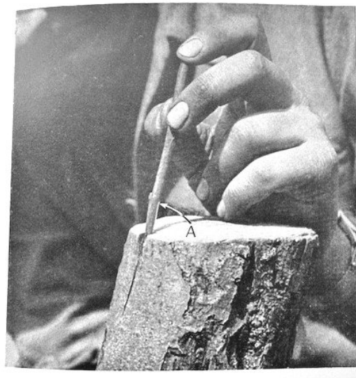
Insertion du greffon.

Faites glisser le greffon sous la partie d'écorce soulevée jusqu'à ce que l'épaulement (A) vienne buter sur le bois du sujet.